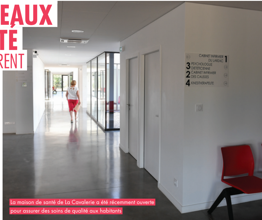
La maison de santé de La Cavalerie a été récemment ouverte pour assurer des soins de qualité aux habitants

Dans ce canton aux vastes dimensions, les réseaux de santé se sont structurés de la même manière avec des pôles multisites pour lutter, avec succès, contre la désertification médicale.