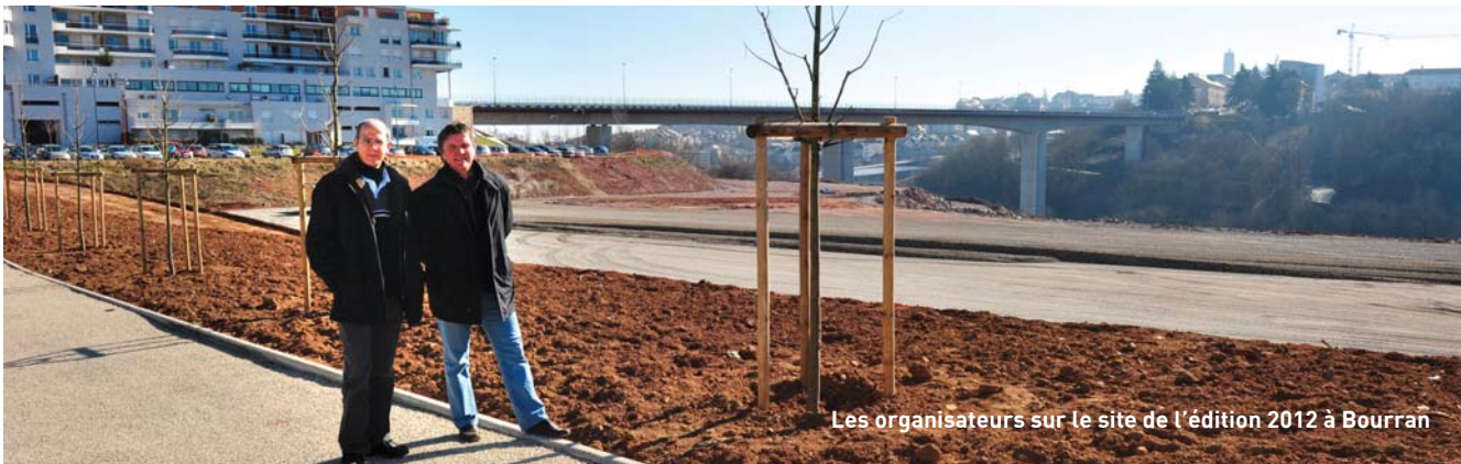
Les organisateurs sur le site de l'édition 2012 à Bourran