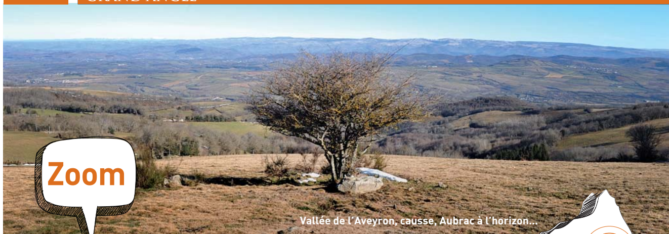
Vallée de l'Aveyron, causse, Aubrac à l'horizon...