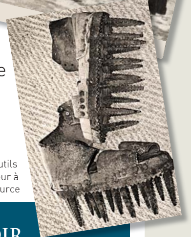
Les outils à l'honneur à Salles-la-Source