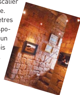
L'intérieur de la tour de Montsalès

Alors que la tour avait été abaissée de sept mètres en 1953, son rehaussement a permis de disposer d'une salle de quelque 50 m 2 d'où l'on a un superbe point de vue sur la région. Depuis trois ans, cinq artistes sont exposés chaque année.