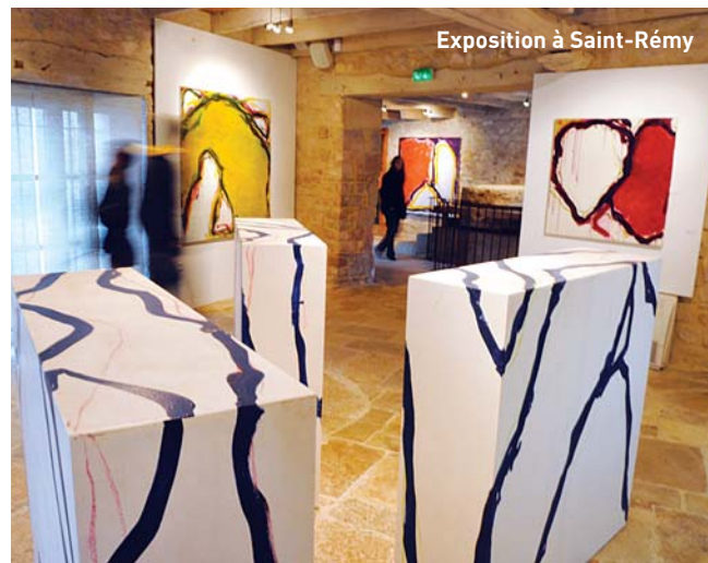
Exposition à Saint-Rémy

Dans la foulée, un deuxième chantier vient d'être entrepris, dans le même esprit : la transformation de l'immense presbytère en gîte d'étape pour les randonneurs sur la variante par Villefranche du chemin de Saint-Jacques-de-Compostelle. Même démarche autour de l'art contemporain à Montsalès où l'ancien donjon du