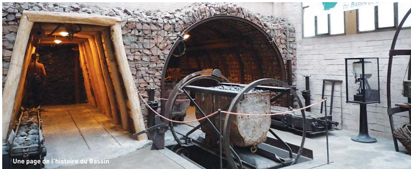
Une page de l'histoire du Bassin