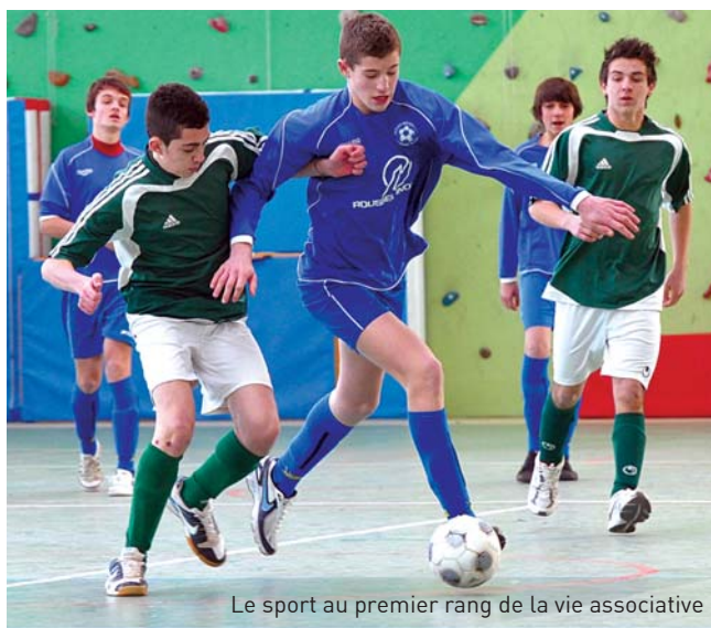
Le sport au premier rang de la vie associative

En termes économiques, l'impact du secteur associatif est majeur dans le département. Plus de 15% de l'emploi privé aveyronnais est porté par des associations avec plus de 11 500 salariés. Dans son Contrat d'avenir pour les