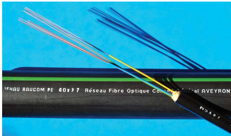
Les technologies au service de la couverture très haut débit

Un Schéma directeur territorial d'aménagement numérique, porté par le SIEDA, a été élaboré. En partenariat avec les collectivités locales, une structure sera prochainement mise en place afin de construire le réseau d'initiative publique (RIP) aveyronnais et de le rendre attractif auprès des opérateurs fournisseurs d'accès. Le déploiement de ce réseau d'initiative publique s'étendra de 2013 à 2025 (2013-2015, 2016-2020, 2021-2025) pour un montant total des investissements estimé à 300 millions d'euros.