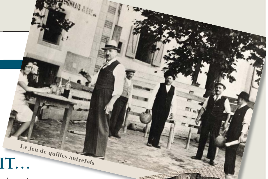
Le jeu de quilles autrefois

Les Musées du Conseil général font de cet inventaire à la Prévert un témoignage fort de l'histoire et de l'identité du département, aussi bien à travers leurs collections permanentes qu'avec les expositions temporaires. La saison 2012 sera riche de propositions pour ces dernières : « Des outils et des hommes » (1 er avril – 21 juin) puis exposition insolite alliant le savoir-faire traditionnel et l'art contemporain (à partir du 21 juin) au musée des arts et métiers traditionnels de Salles-la-Source ; une sélection de documents et d'objets anciens sur les quilles au musée Joseph Vaylet – musée du scaphandre et « Aqua Cosmos subaquatique Aveyron » au musée des mœurs et coutumes (anciennes prisons) à Espalion ; « Les maîtres du cuivre » et « Trésors archéologiques de Montrozier et de ses environs » à l'Espace archéologique départemental de Montrozier.