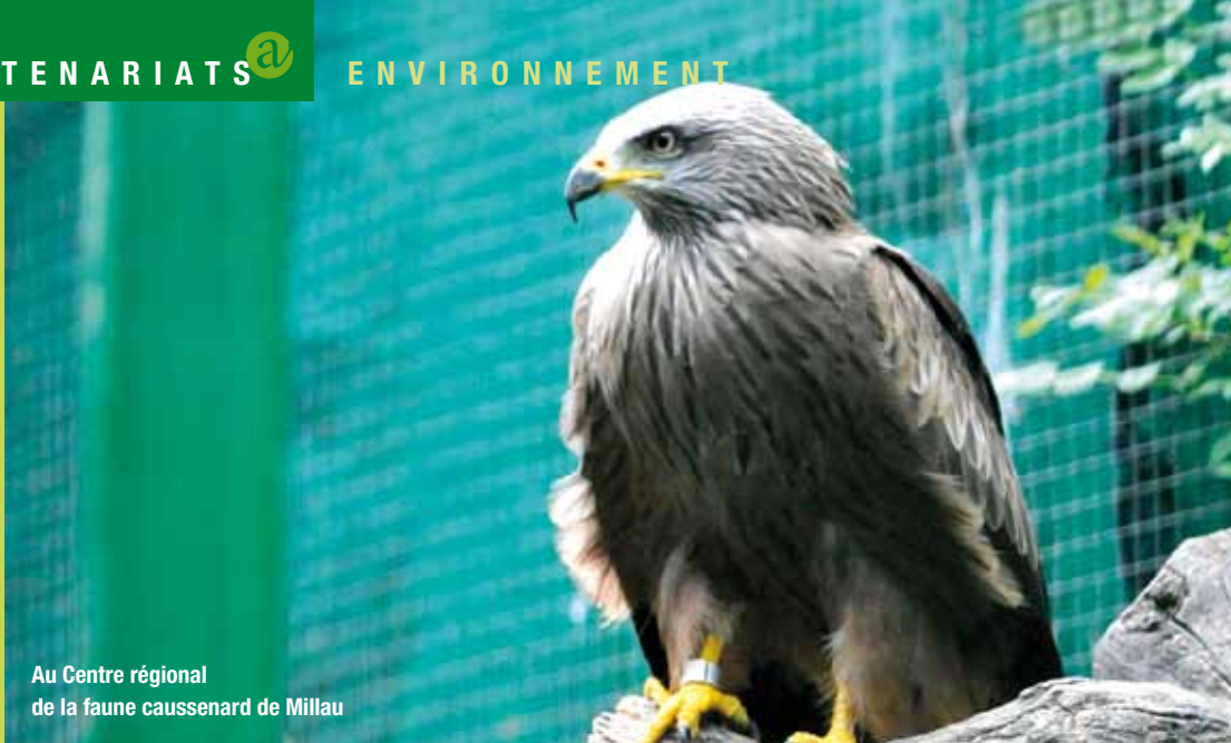
Au Centre régional de la faune caussenard de Millau

Le Conseil général participe à cette action en apportant une aide financière.