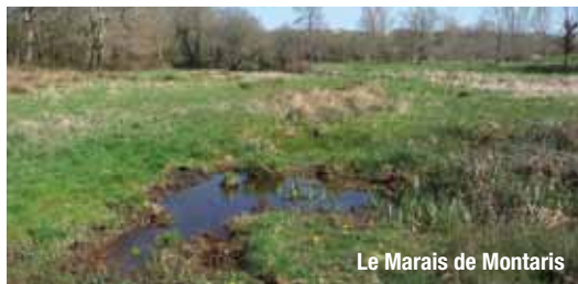
Le Marais de Montaris