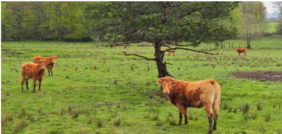
L'agriculture aveyronnaise toujours en difficulté