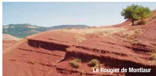
Le Rougier de Montlaur