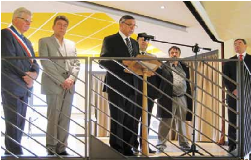
Les personnalités lors de l'inauguration

La nouvelle salle multi cultures de Fondamente (la première version datait de 1957) a été inaugurée le 17 avril dernier. Elle constitue un bel outil pour l'animation de la commune.