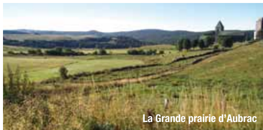
La Grande prairie d'Aubrac