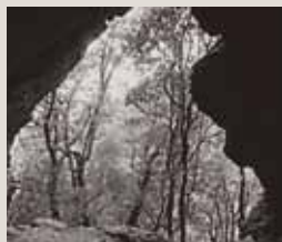
La grotte de Panissole

Lorsque Jean Carrier est informé du sort qui lui est fait, il se met en route pour Peniscola. Mais lorsqu'il y parvient, Benoît XIII est mort et son successeur (Clément VIII) a été désigné par les trois autres cardinaux. Jean Carrier estime que l'élection n'est pas valable et, les autres cardinaux n'étant pas d'accord avec lui, il s'érige en collègue à lui seul et élit un autre Rouergat comme pape : Bernard Garnier (Benoît XIV) dit le pape caché. Mais Carrier, prudent, ne révèle cette élection au comte d'Armagnac que trois ans plus tard. Quand celui-ci l'apprendra, il demandera son avis à Jeanne d'Arc, réputée comme l'on sait pour avoir un lien direct avec les voix célestes. Mais celle-ci lui répond qu'elle part prendre Paris et n'aura pas le temps de donner une réponse à d'Armagnac, lequel finira par abandonner son pape. Nombreux sont toutefois ceux – surtout des théologiens – qui estiment que la lignée s'est maintenue. Un temps réfugiée en plusieurs endroits stratégiques de la vallée du Viaur puis à Jalenques jusqu'à environ 1430, cette Eglise secrète par opposition à l'Eglise militante que serait celle de Rome pourrait ne pas s'être éteinte aussi tôt qu'on le prétend.