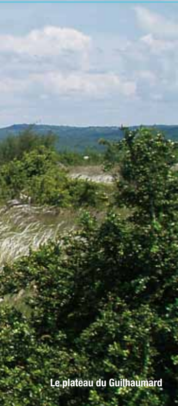
Le plateau du Guilhaumard