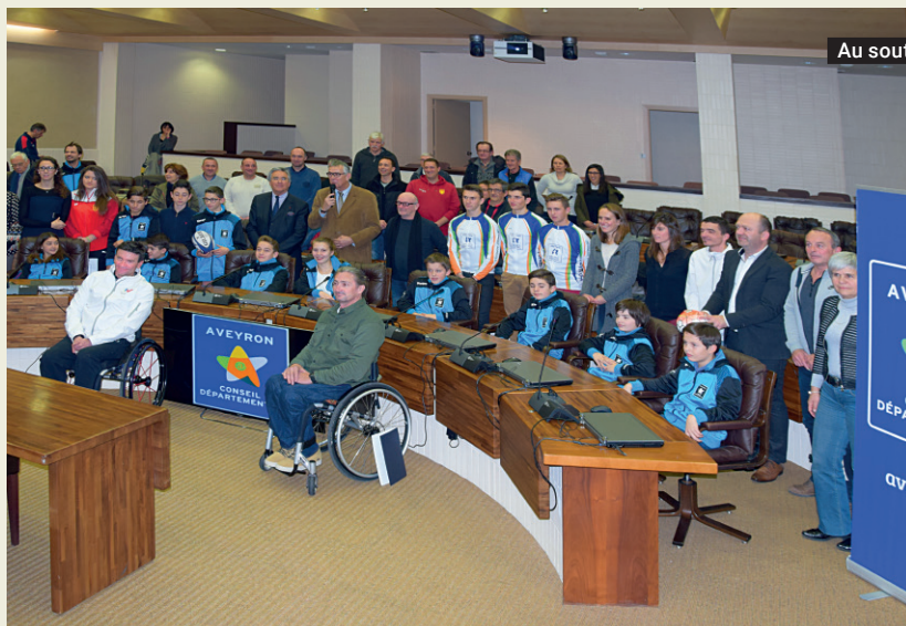
Au soutien des comités sportifs

Le 19 janvier, le Conseil départemental a souligné toute l'attention portée par la collectivité au sport en braquant les projecteurs sur le partenariat avec les comités sportifs départementaux. Ainsi le Département a créé un dispositif d'appel à projets pour encourager les comités sportifs départementaux à porter des projets innovants et qui s'inscrivent dans la durée. Sept d'entre eux ont été retenus par le jury au terme de la procédure qui régit le dispositif : tennis, cyclisme, football, hand, rugby, quilles de huit et handisports. Ils vont bénéficier d'une aide totale de près de 45 000 €.