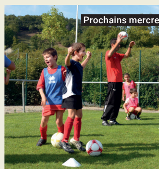
Prochains mercredis du foot