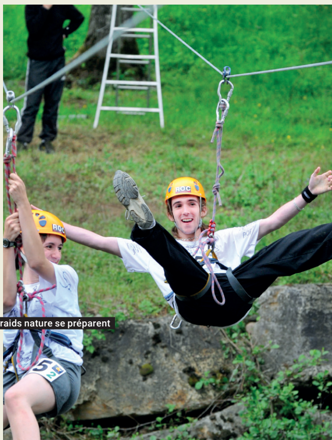
Les raids nature se préparent

Le Conseil départemental de l'Aveyron soutient toutes les équipes de sport de division nationale au travers de ses partenariats sportifs.