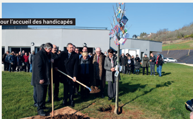
Pour l'accueil des handicapés

Le foyer de vie de Villefranche-de-Rouergue (45 places) est ouvert. Il complète le dispositif ADAPEI d'accueil des handicapés mentaux dans le département, notamment des plus âgés d'entre eux.