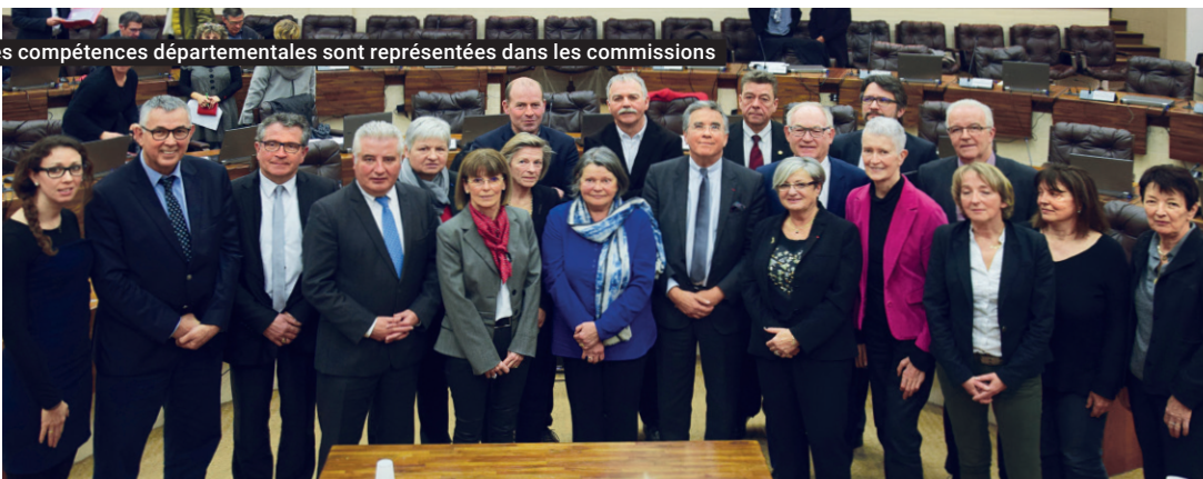
Toutes les compétences départementales sont représentées dans les commissions