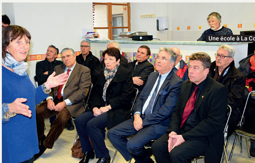
Une école à La Couvertoirade

Le projet est de ceux qui symbolisent la confiance en l'avenir. Pour sa première sortie « sur le terrain », le président Jean-François Galliard est venu annoncer aux élus de la commune que le Conseil départemental accompagnerait cette réalisation importante pour le plateau du Larzac et dans le contexte de l'installation de la Légion étrangère.