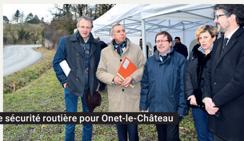
Plus de sécurité routière pour Onet-le-Château