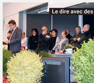
Le dire avec des fleurs

D'importants travaux vont être réalisés sur la RD 901, route de Rodez à Marcillac (des pointes de 6 700 véhicules par jour), dans sa traversée de la commune d'Onet-le-Château. Près de 1,4 M€ vont être notamment investis par le Conseil départemental, la commune et Rodez Agglomération pour assurer la sécurité au carrefour de Fontanges.