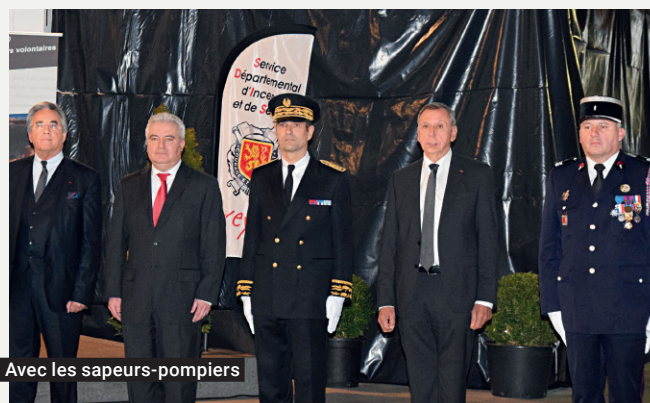
Avec les sapeurs-pompiers

Le foyer de vie de Villefranche-de-Rouergue (45 places) est ouvert. Il complète le dispositif ADAPEI d'accueil des handicapés mentaux dans le département, notamment des plus âgés d'entre eux.