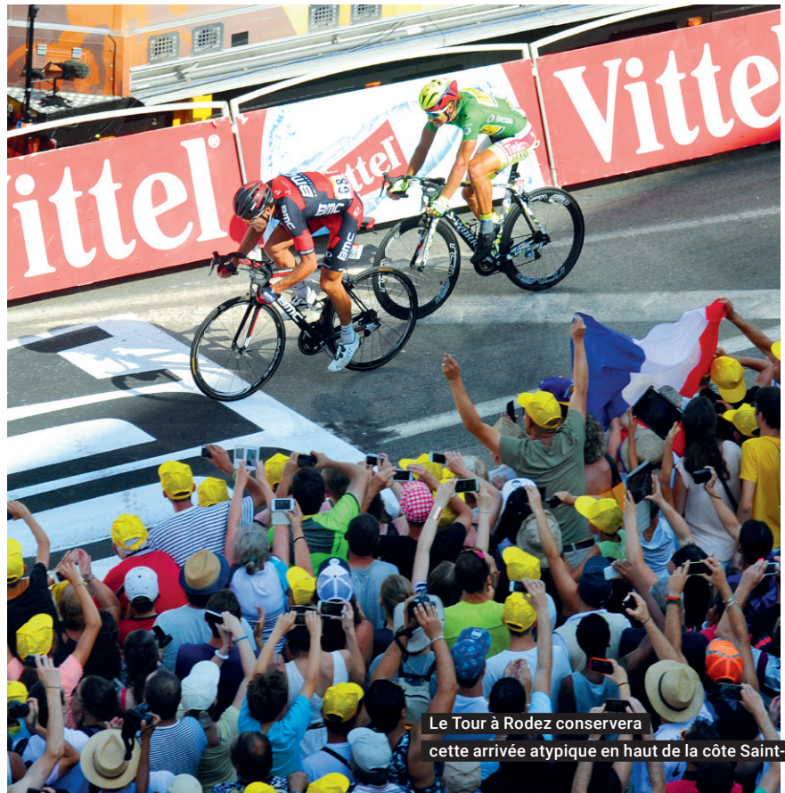
Le Tour à Rodez conservera cette arrivée atypique en haut de la côte Saint-Pierre

direction du Puy en Velay. D'ores et déjà, la cité aveyronnaise a préparé son parcours avec un départ fictif devant le célèbre foirail et un départ réel du Pont de Palmas. Ici aussi la notion de transition ne sera que toute relative. Car rapidement la descente vers Saint-Geniez pourrait être propice aux premières escarmouches, avant de s'attaquer aux contreforts de l'Aubrac jusqu'à la montée de Naves d'Aubrac, passant en une dizaine de kilomètres de 440 m d'altitude à 1058 m d'altitude. Puis il faudra traverser tout l'Aubrac à plus de 1000 m d'altitude sur plus de 50 km, en direction du Puy en Velay. Autant dire que ces deux étapes pourraient réserver quelques surprises sur le tour de cette édition 2017.