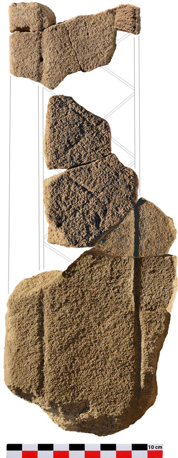
Fig. 2 : Restitution d'un angle de monolithe décoré provenant de l'u.s. 1014 (DAO Jérôme Trescarte).

Un premier décapage de l'ensemble de la surface du tertre u.s. 1011/1051 (phase IIa), monumentalisé par le monument B du podium (phase IIb), a été réalisé. Ses contours demeurent encore approximatifs : environ 16 à 19,50 m de long, selon un axe nord-est - sud-ouest, sur 10 à 13 m de large. Sa surface et ses abords offrent d'ores et déjà une originale structuration, avec deux bases de stèles en grès (n° 13 et 40) encore fichées et 174 pierres brutes en calcaire local plantés, parfois calées, selon