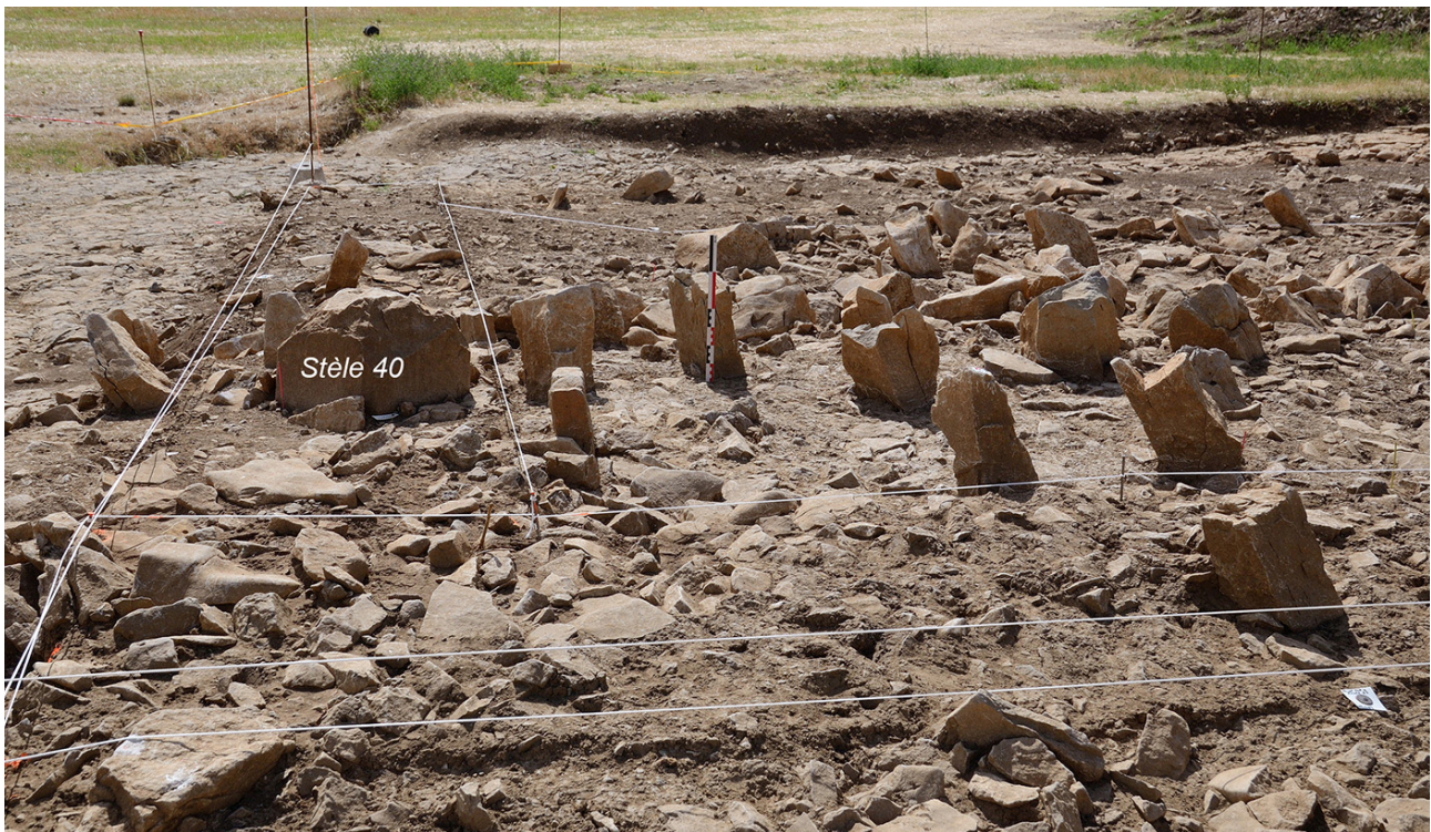
Fig. 3 : Quelques pierres dressées à la surface du tertre u.s. 1011/1051, ici autour de la stèle 40.

remploi dans les matériaux de ce tumulus (?) du premier âge du Fer (VI e siècle av. J.-C. ?). La découverte d'un fragment d'ulna droit de périnatal vient s'ajouter à plus de soixante-dix pièces osseuses humaines isolées et en position secondaire. Jusqu'ici découvertes dans les parties remaniées de ce tertre par le monument B, ces vestiges appartiennent à cinq individus non brûlés, très incomplets : un enfant de 8-12 ans, un adolescent d'environ 18 ans, deux adultes dont probablement une femme et son bébé (étude Bernard Dedet).