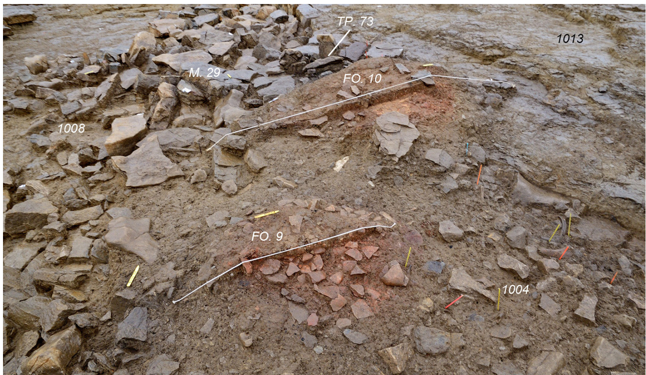
Fig. 5 : Le secteur des foyers FO. 9 et 10 en cours de démontage sur une moitié de leur sole d'argile.