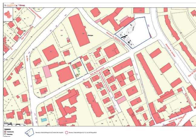
Fig. 1 : Localisation des vestiges chalcolithiques du Centre des impôts et du 15, rue de Roquefort.